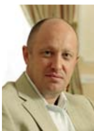
Евгений Пригожин Владелец Concord Catering

На рынке кейтеринговых услуг сейчас наблюдаются следующие тенденции: